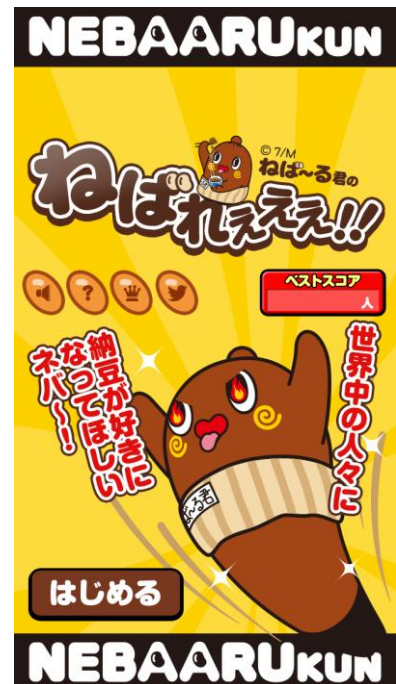
<ねば～る君のねばれえええ!!>