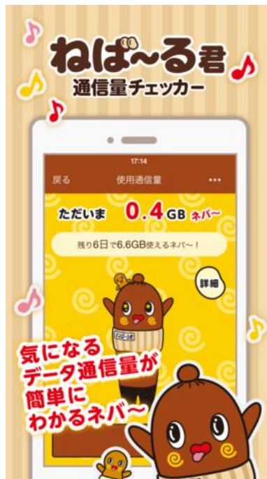
<ねば～る君通信量チェッカー>